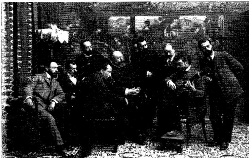
Tárrega en 1906 durante una Reunión íntima en Valencia